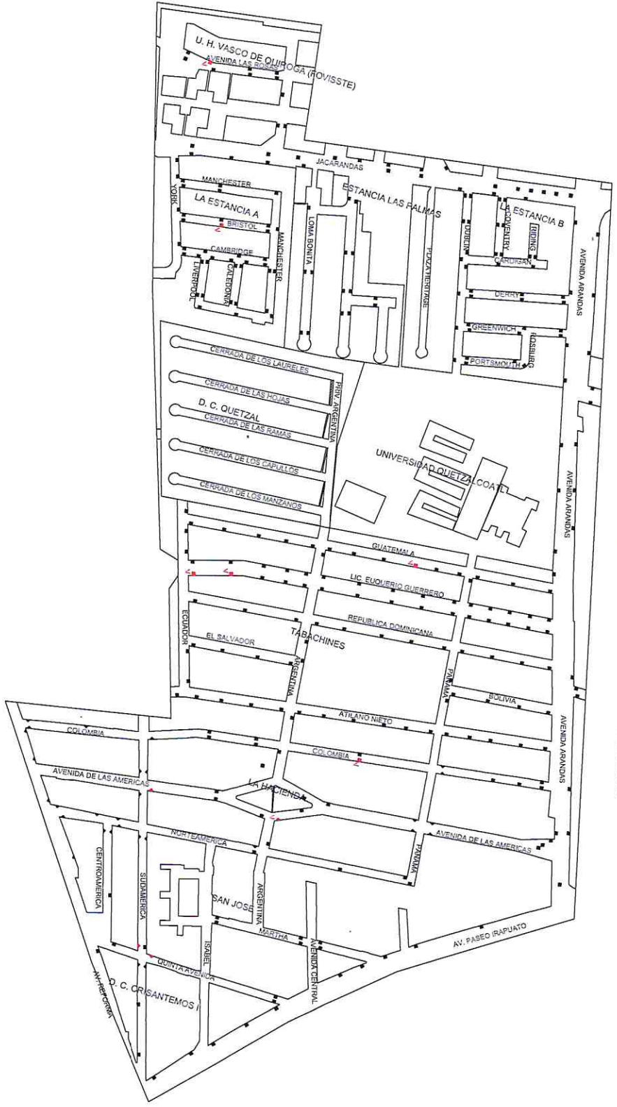
RECORTE DE PLANO DEL MARTES 03 DE JULIO DEL 2018

Handwritten signature or initials in blue ink.