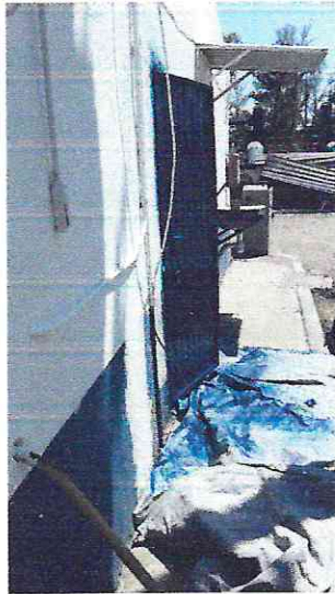
LIMPIEZA DEL TERRENO DEL CÁRCAMO